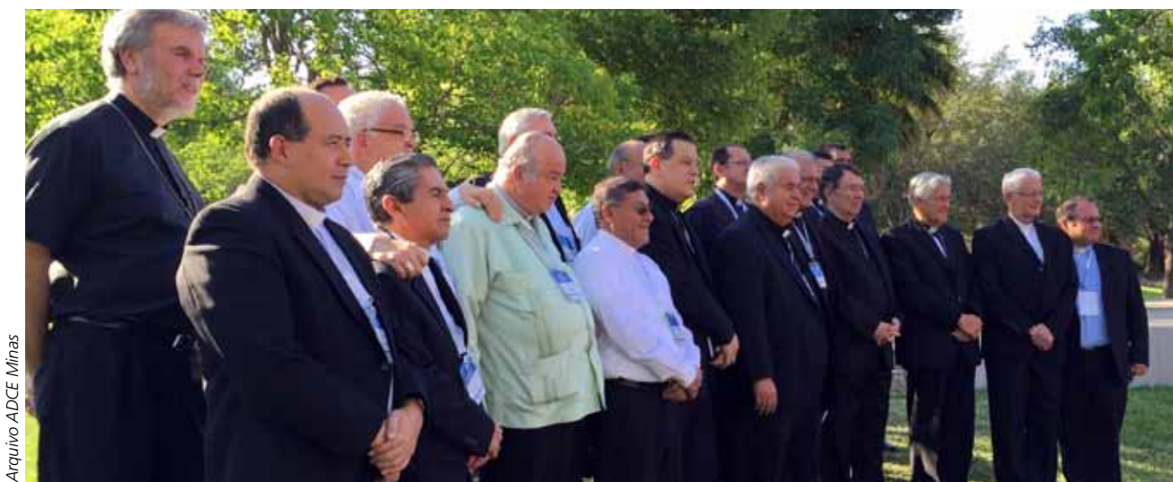
Arquivo ADCE Minas

social, ressaltou que somente os procedimentos de “compliance” implantados pelas empresas e as leis não estão sendo suficientes para conter a corrupção. “É necessário um renovado processo de educação para conscientizar os agentes públicos e privados da importância da aplicação de conceitos e práticas empresariais e sociais, que tornem o ambiente empresarial mais ético, justo e humano”, destacou.